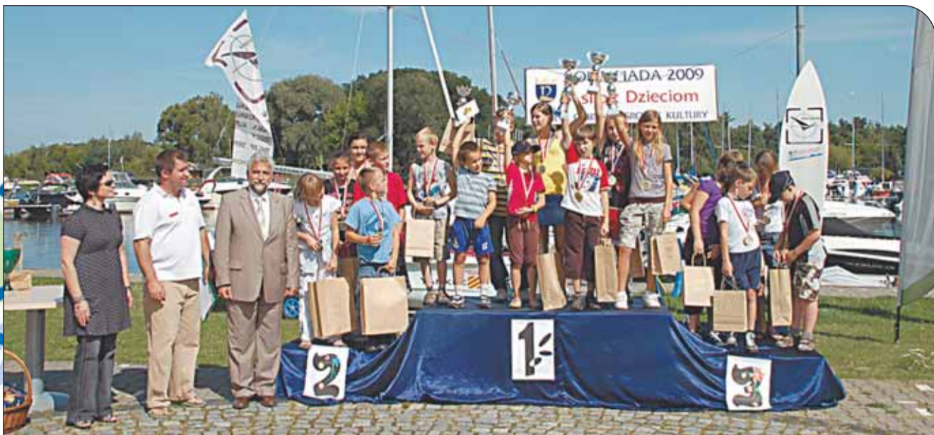
Wręczenie nagród uczestnikom Olimpiady