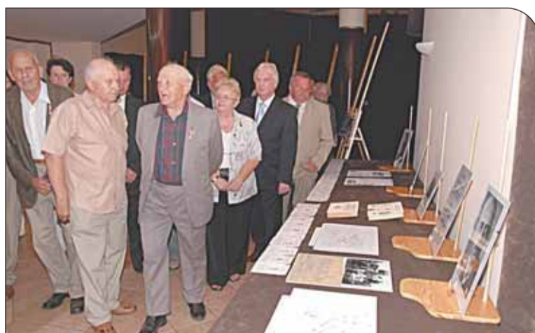
Wystawa pamiątek w GOK

Przy pomniku, w asyście harcerzy z drużyny „Wilki”, złożone zostały wiązanki biało-czerwonych kwiatów. Następnie uczestnicy uroczystości