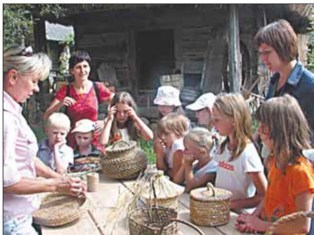
Wizyta w skansenie w Kuligowie