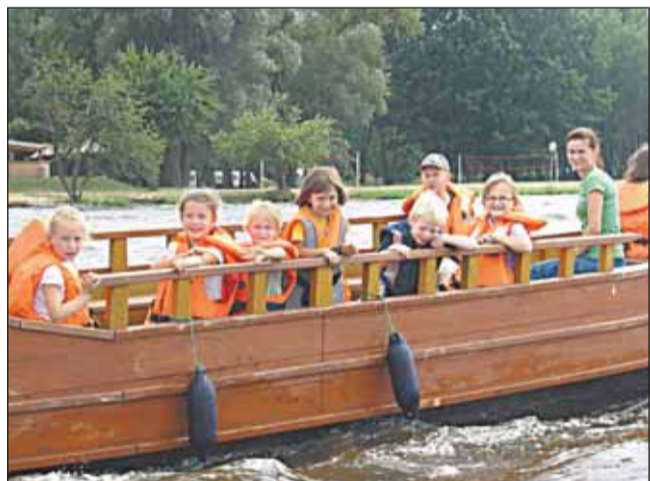
W drodze na Zalew Zegrzyński