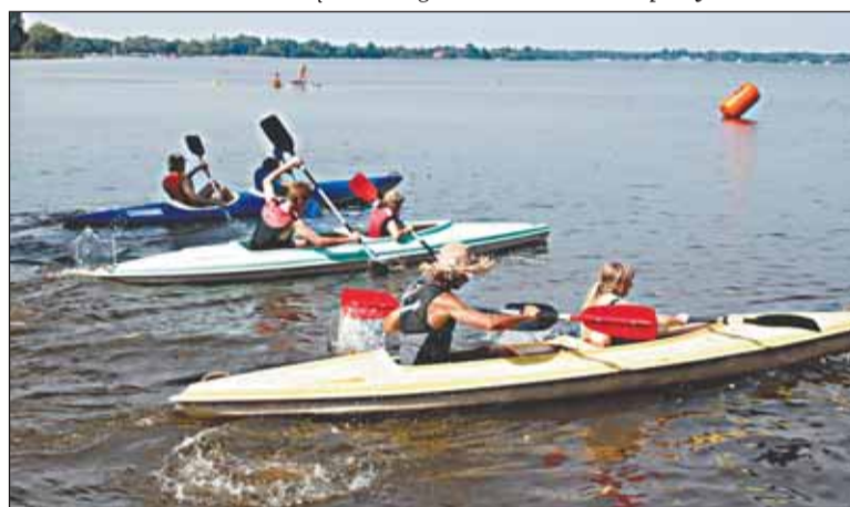
Olimpiada Port Dzieciom w Porcie Jachtowym w Nieporęcie – zawody kajakarskie