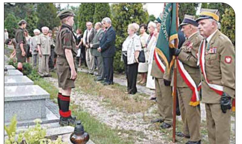
Złożenie kwiatów na grobie żołnierzy AK

gionu Gminy Nieporęt. Wyeksponowane na niej zostały m.in. dokumenty, zaświadczenia i zdjęcia osób walczących w powstaniu, wydawnictwa opisujące działania wojenne, historia oddziału Armii Krajowej