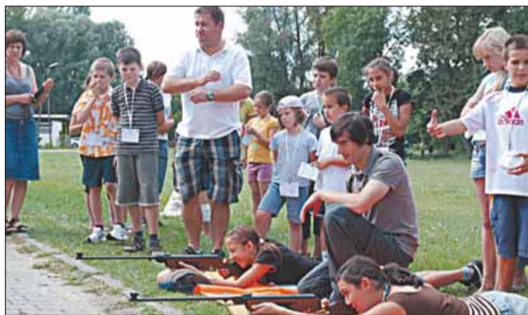
Olimpiada – strzelanie