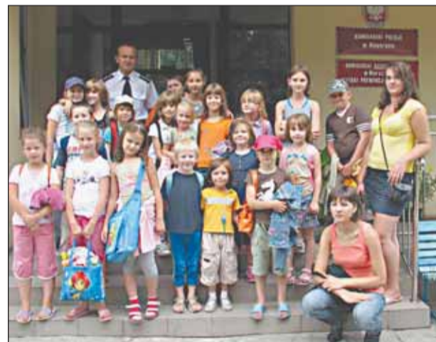
Wizyta w Komisariacie w Nieporęcie dostarczyła wielu wrażeń